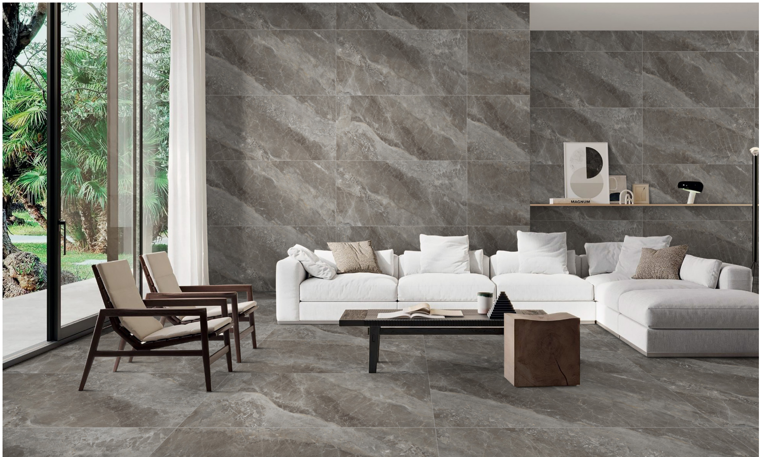
GRIS (GRIS FONCÉ)